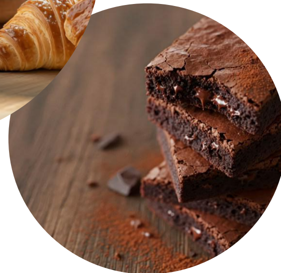
Photo non contractuelle Minimum de commande : 20 personnes Délai de commande : 48 h avant la livraison