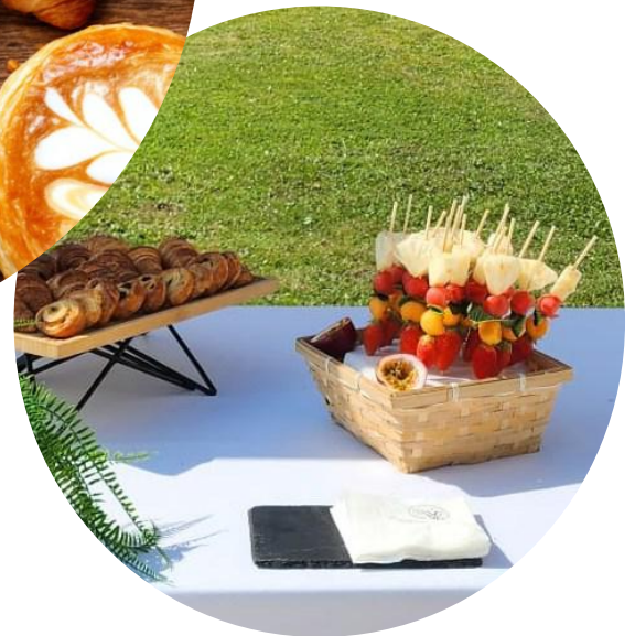
Photo non contractuelle Minimum de commande : 20 personnes Délai de commande : 48 h avant la livraison