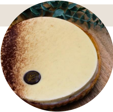
Tarte Vanille intense