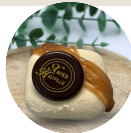
Planche dessert de 12 pièces