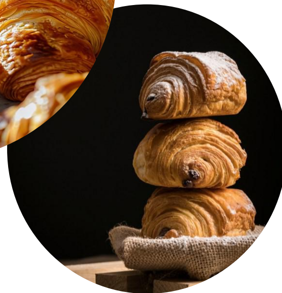
Photo non contractuelle Minimum de commande : 20 personnes Délai de commande : 48 h avant la livraison